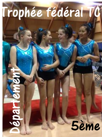
Trophée fédéral TC