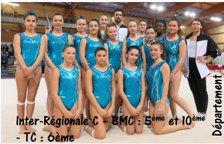
Inter-Régionale C - BMC : 5 ème et 10 ème - TC : 6 ème